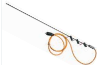
[ 2 ] Varilla de calefacción