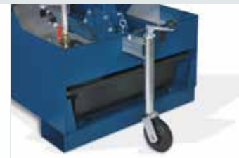
Roue de support