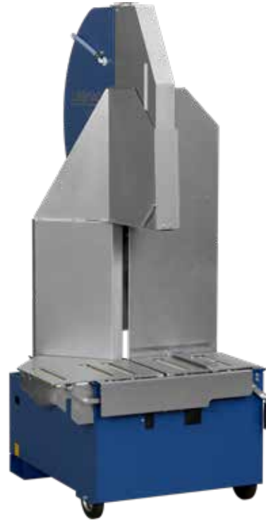
DTS 420 PE/N