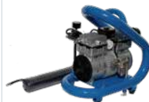
[ 7 ] Vakuumpumpe