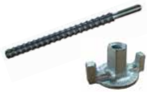
[ 2 ] Schnellspannspindel