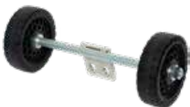
[ 5 ] Radsatz CDR 250