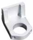
[ 1 ] Spannhals