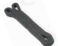
[ 4 ] Vakuumdichtring