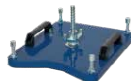
[ 8 ] Vakuumplatte